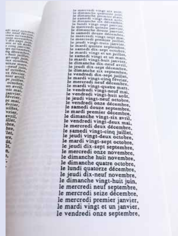
Claude Closky, Les 366 jours de l'année 1992 classés par ordre de taille, COLLECTION PRIVÉE, le moule à gaufres no4, Éditions Méréral. © Claude Closky et les éditions Méréral, été 1992

Nous vous remercions pour votre compréhension.